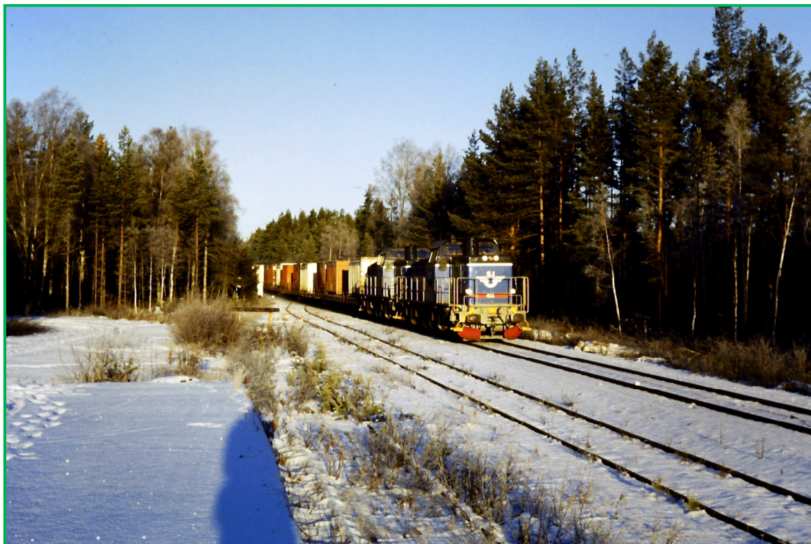
Fågelsjö i november 1995.