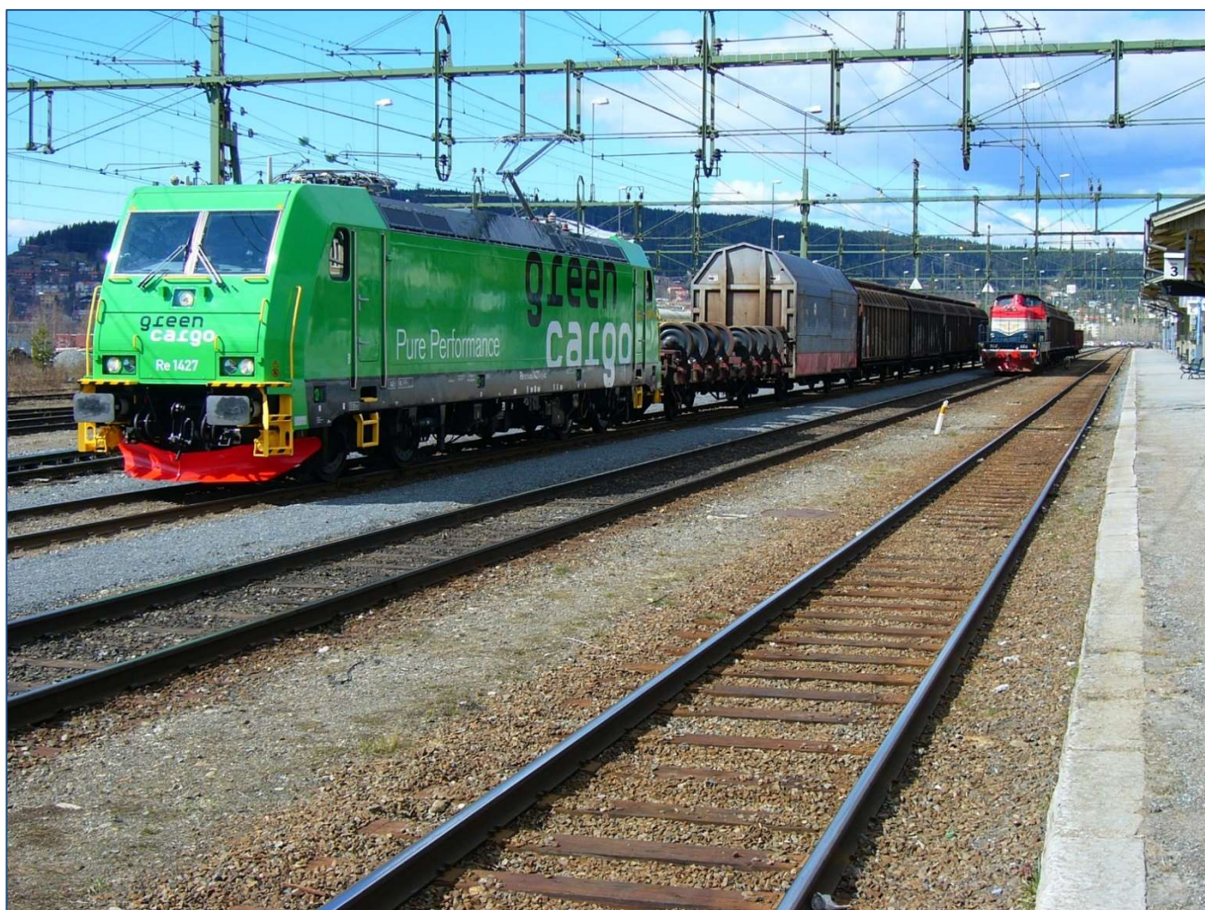
Ett modernt Re och ett äldre T43 lok på Östersunds Central i maj 2010.