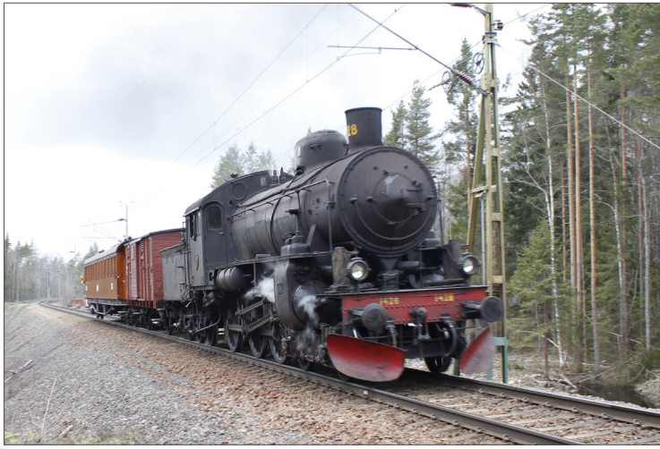
SJ B 1428, ett av de två ånglok som kommer att svara för dragkraften på de båda resorna.